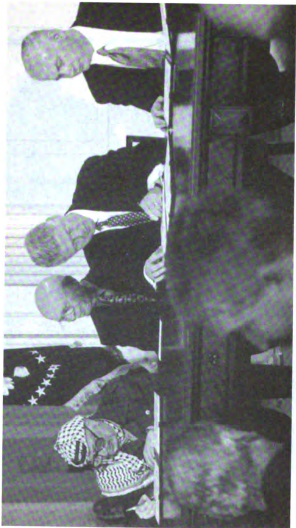
يوثق اتفاقية واي ريفر (١٩٩٨/١٠/٢٣) في البيت الأبيض